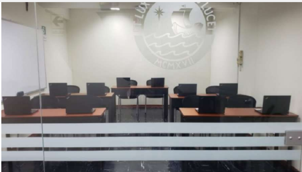
Gráfico 09: Implementación de laboratorio tecnológicos para las Clínicas Jurídicas de la PUCP