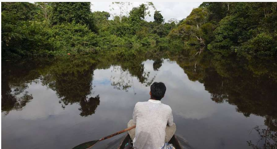
Gráfico 01: Defensores Ambientales en la Amazonía