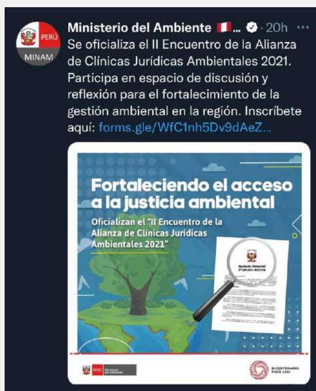
Gráfico 07: Difusión oficial del Ministerio del Ambiente