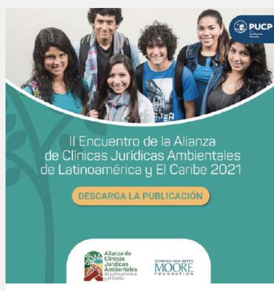
Gráfico 08: Difusión del II Encuentro de la Alianza de Clínicas Jurídicas Ambientales de Latinoamérica y el Caribe 2021

Conoce más sobre la Alianza y el II Encuentro en esta nota de ventana Jurídica de la Facultad de Derecho de la PUCP: https://facultad.pucp.edu.pe/derecho/ventanajuridica/publicaciones-ponencias-del-ii-encuentro-de-clinicas-juridicas-ambientales-de-latinoamerica-y-el-caribe/?utm_source=Boletin%20noticias&utm_medium=correo%20electronico&utm_campaign=Boletin%20Derecho%20Hoy&fbclid=IwAR3sgv5spviUrtDqVmZ9pQi-SELMulPr-qosZz9dh9HxxJI7dTg4EolY-F4