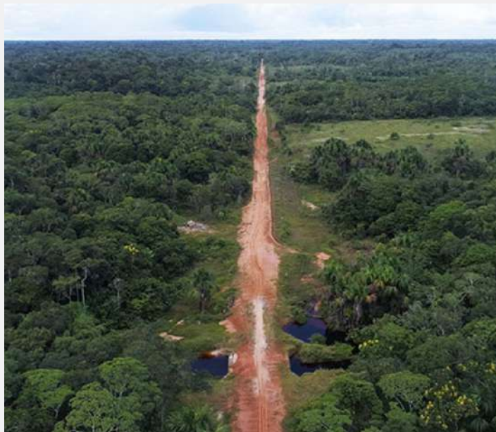
Gráfico 03: Trazo de la Carretera Jenaro Herrera – Colonia Angamos

Fuente: Portal web Actualidad Ambiental de la Sociedad Peruana de Derecho Ambiental ( https://www.actualidadambiental.pe/loreto-via-illegal-que-afectaria-indigenas-aislados/ )