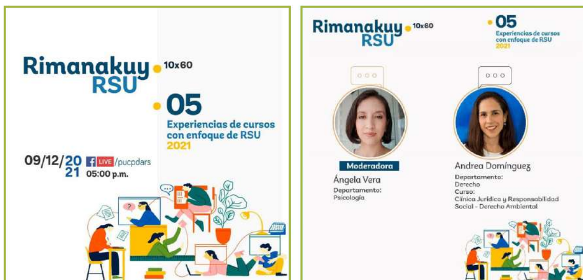
Gráfico 10: Exposición de la Clínica Jurídica Ambiental en el espacio virtual Rimanakuy RSU 10X60